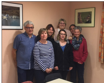
Assemblée générale du Comité des Fêtes, le nouveau comité