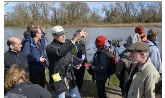
Porte du Ried Nature : à la recherche des premiers oiseaux migrateurs

Syndicat Pôle Ried Brun 24 rue Vauban 68320 Muntzenheim tél : 03.89.78.63.80 - contact@cc-riedbrun.fr