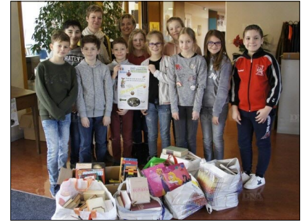
Ecole P. Friehe : collecte de livres pour l'ESAT Solidarité du Rhin