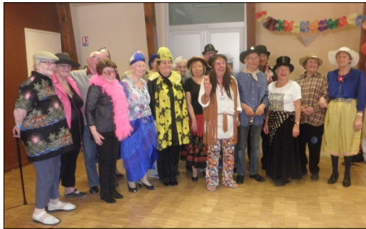
Après-midi carnaval pour les Amis de la Belle Epoque