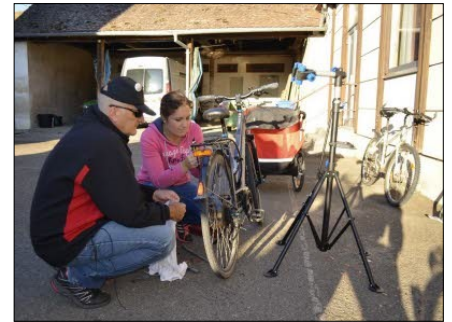
Atelier vélo organisé par Porte du Ried Nature