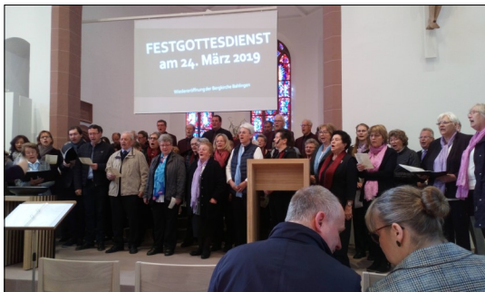
Une délégation de la chorale Ste Cécile à l'inauguration de l'église rénovée de Bahlingen