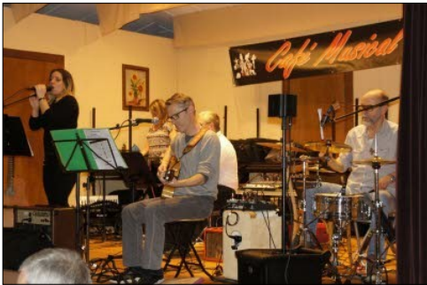
Soirée musicale organisée par les Comédiens du Ried