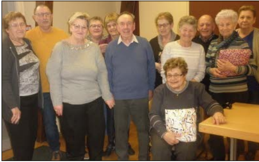
Amis de la Belle Epoque : assemblée générale et fête des anniversaires