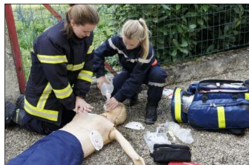
Manœuvre des sapeurs-pompiers à l'église Sainte Marguerite