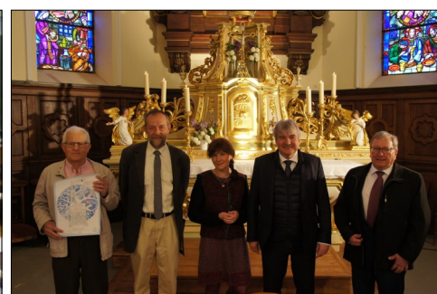
Eglise Sainte Marguerite : bénédiction du maître autel rénové