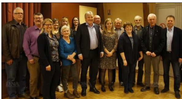
La Jeunesse du Ried Brun a fêté ses 25 ans