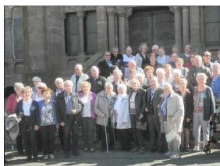
Sortie printanière des Amis de la Belle Epoque