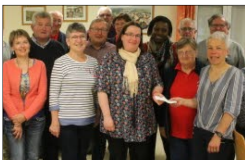
AG de l'Amicale des Donneurs de sang de Riedwihr/Jebnheim