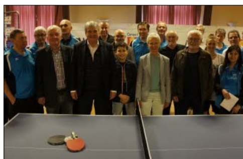
Inauguration des nouvelles tables du Holtzwihr Tennis de Table