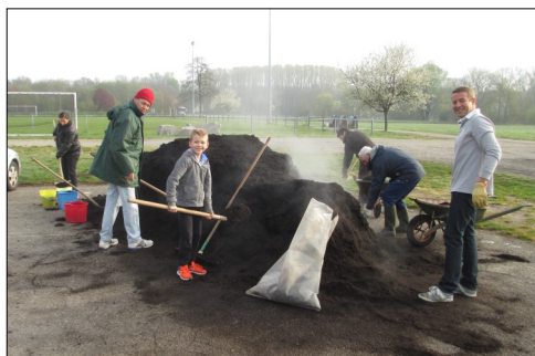
Distribution gratuite de compost