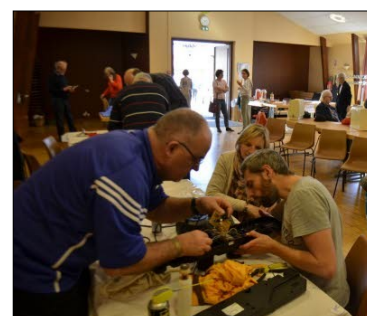
Repair Café organisé par Porte du Ried Nature