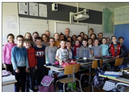
Ecole P. Frieh : le football s'invite à l'école