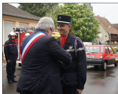
Remise de médailles et promotions au sein du CPI des sapeurs-pompiers de la Commune nouvelle