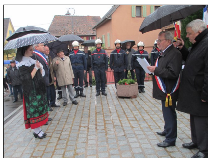
Cérémonie commémorative du 8 mai 1945